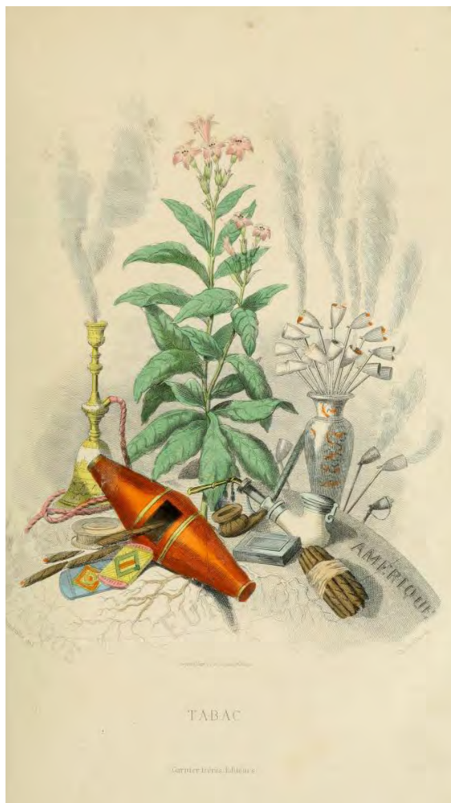
Afb. 11. Prent uit Les Fleurs Animées.