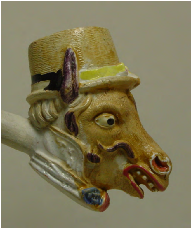
Afb. 3. L'âne coquet, Gambier nr.659.

die spelen. Deze stijl gebruikt hij daarna vaker zoals in Scènes de la vie privée et publique des animaux , waarvan de illustraties later worden gebruikt op tarotkaarten.