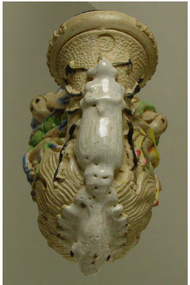
Afb. 10. Onderzijde van de pijp met een kikker en kever.

Op de linkerzijde zien we de personificatie van de korenbloem (afb. 8) en op de voorzijde van de ketel de papaver (afb. 7). Deze twee bloemenvrouwen 'Bleuet et Coquelicot' worden beschreven in het hoofdstuk d'une Bergère Blonde, d'une bergère brune et d'une reine de