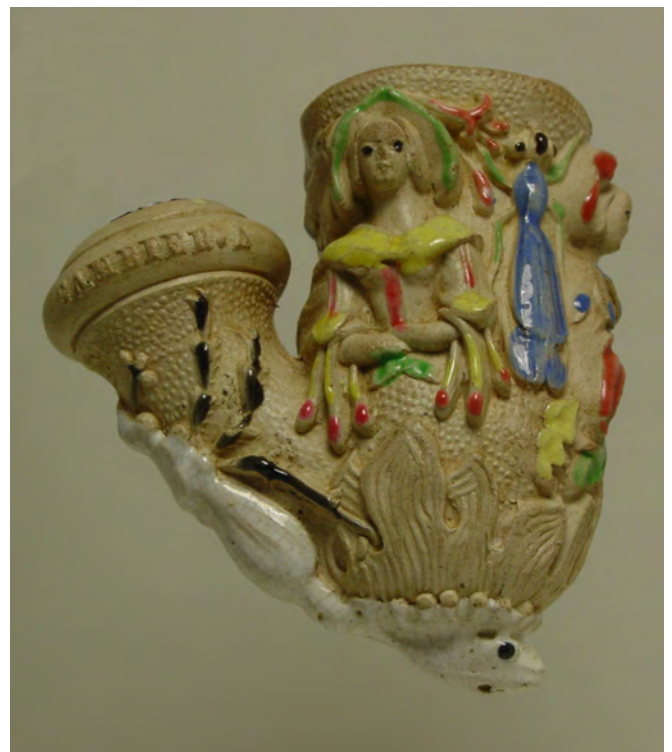
Afb. 6. Chevrefeuille op de rechterzijde van de pijp.