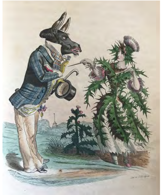
Afb. 4. Prent van J.J. Grandville uit les Fleurs animées , 1847.

De ontwerpen van Grandville staan vaak bekend als onnatuurlijk en absurd maar weten tegelijkertijd op scherpe wijze de karakters weer te geven. Hij sterft op