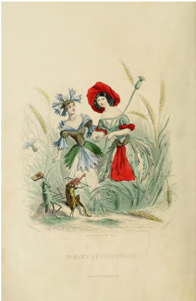
Afb. 9. 'Bleuet et Coquelicot' (korenbloem en papaver) uit Les Fleurs animées .