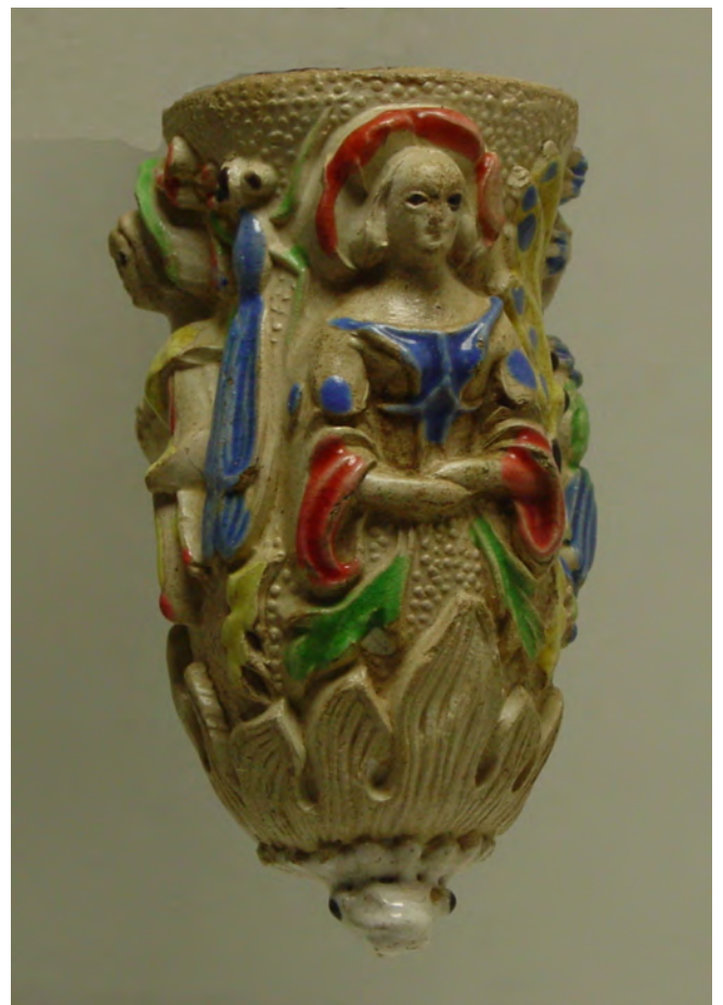
Afb. 8. Linkerzijde met 'Bleuet' (korenbloem).