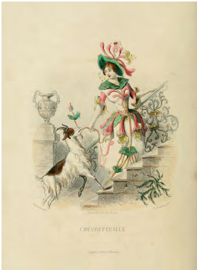
Afb. 5. Chevrefeuille (kamperfoelie) uit Les Fleurs animées.