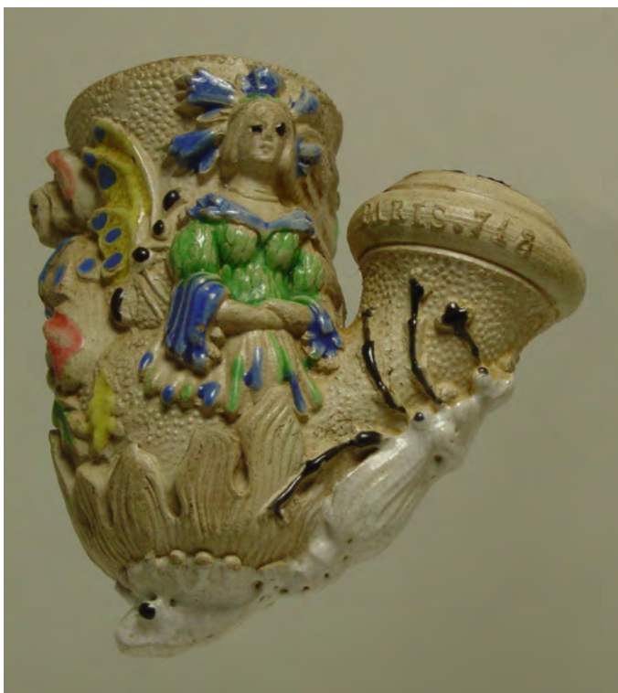
Afb. 7. Voorzijde met 'Coquelicot' (papaver).