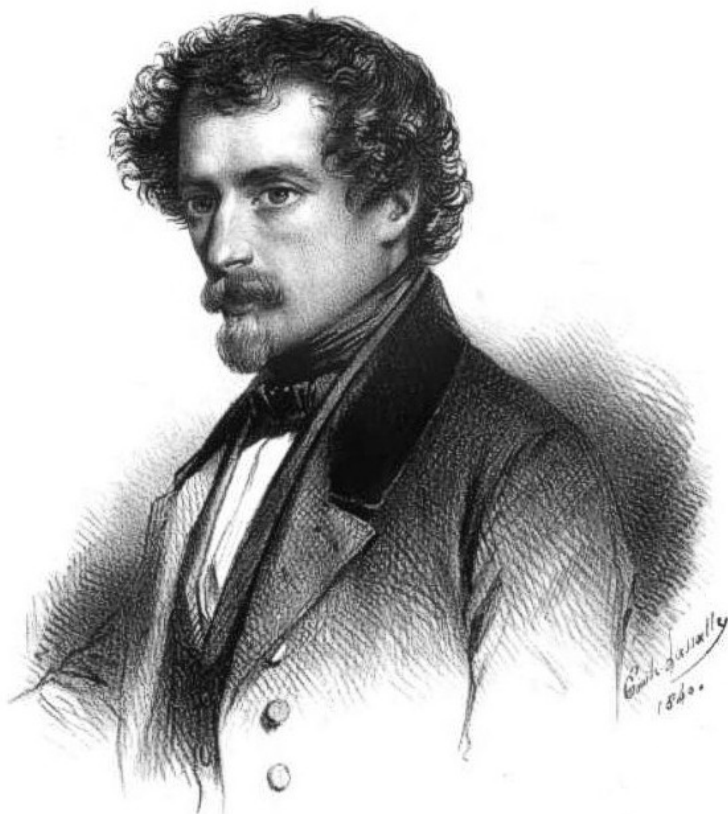
Afb. 1. Portret van Grandville door Émile Lassalle (1840).

Naar aanleiding van de aankoop van een Gambierpijp met een bijzondere decoratie begint een zoektocht om meer over het ontwerp te weten te komen. De pijp is genummerd met vormnummer 718, getiteld 'Fleurs Animées' en is in geen van de bekende catalogi afgebeeld. Ook is deze pijp niet opgenomen in de 'nomenclatures' of modellenlijsten, maar staat wel in de inventarisatielijst uit 1858. In dit handgeschreven document worden de voorraden pijpen met hun vormnummers genoemd welke op dat moment aanwezig zijn in het depot op de Rue de l'Arbre-Sec 20 in Parijs. Het feit dat deze pijp in latere catalogi niet meer vermeld wordt toont aan dat hij kort in omloop is geweest.